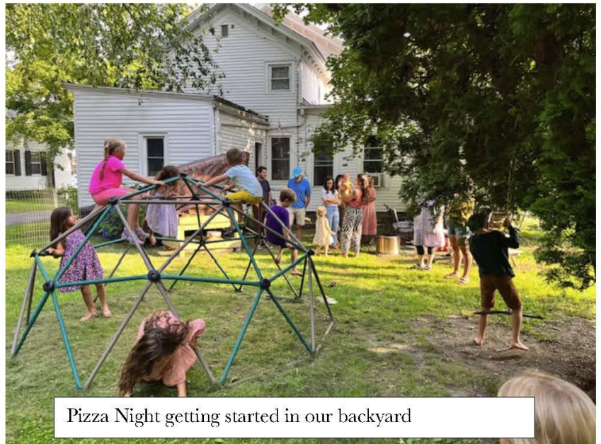
Pizza Night getting started in our backyard