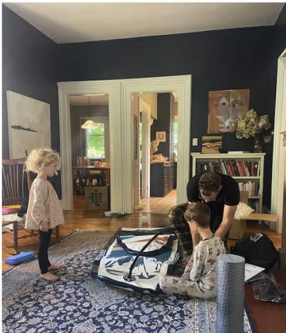
This is our living room – setting up the stand up paddle board